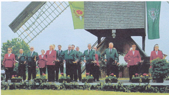
Jagdhornbläserkorps Auerhahn Dortmund in der Kreisjägerschaft Dortmund e.V.