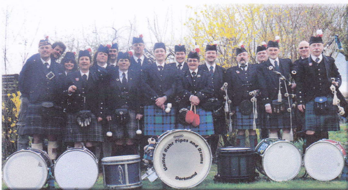
United Pipes and Drums Dortmund

Wir bedanken uns für die freundliche Unterstützung bei folgenden Unternehmen