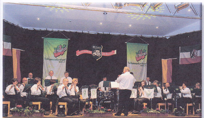
Trommlerkorps St. Barbara